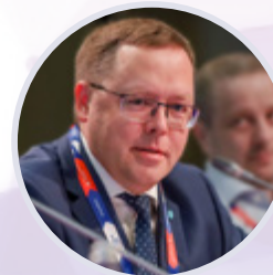
Андрей Карпов Председатель правления Российской Ассоциации экспертов рынка ритейла