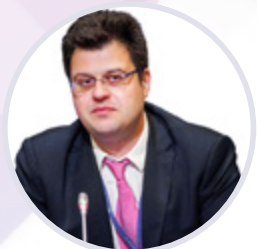
Никита Кузнецов Директор Департамента развития внутренней торговли Минпромторга России