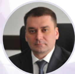
Алексей Гусев Министр торговли и услуг Республики Башкортостан