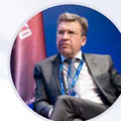
Владлен Максимов Президент Ассоциации малоформатной торговли России